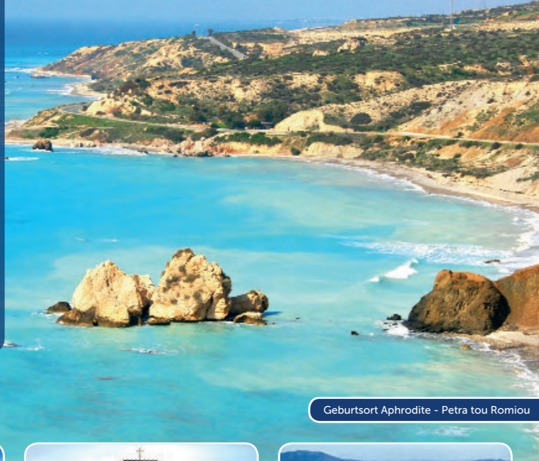
Geburtsort Aphrodite - Petra tou Romiou